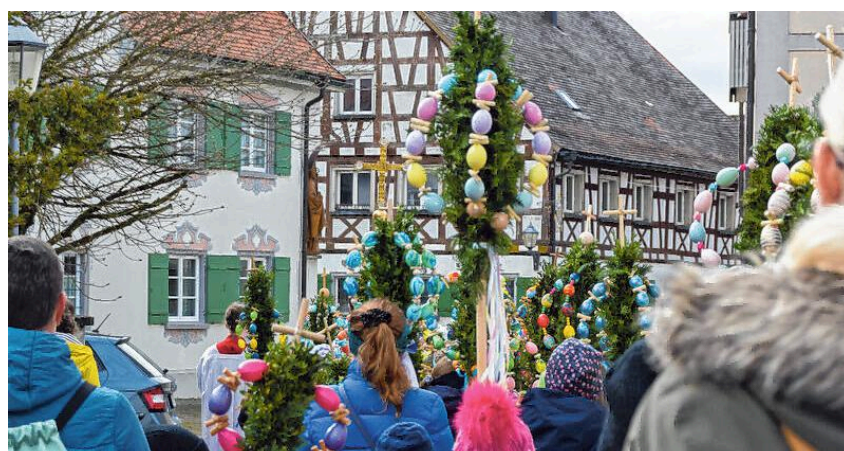
Palmen vor dem Kißlegger Pfarrhaus.