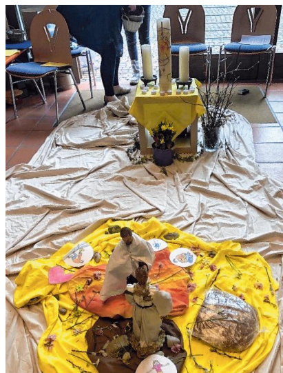
Gottesdienst in der Fastenzeit für Kleine und ganz kleine Kinder