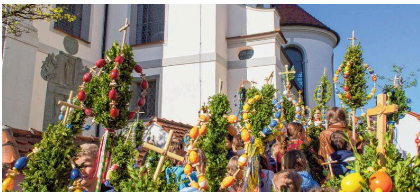
Palmen vor der KiBlegger Pfarrkirche

tatkräftig mitgeholfen haben – beim Organisieren, Austeilen der Säcke und Infozettel, beim Befüllen der Hänger und LKW und deren Zurverfügungstellung und der Fahrer beim Einsammeln der Kleidersäcke. Und natürlich von Herzen „Danke“ für jede einzelne Kleiderspende.